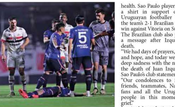
Uruguayan national team players were among those expressing their condolences. "Pain, sadness, it is hard to explain," Inter Miami striker Luis Suarez said. "May he rest