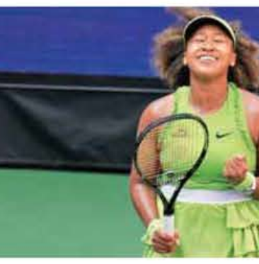
Australian Open in 2019 and 2021, and her matchup against 2017 French Open champion Ostapenko marked the first time two past major champs faced off in the opening round at the U.S. Open since Serena Williams defeated Maria Sharapova five years ago. Another such contest came Tuesday night, when 2020 Australian Open

champion Sofia Kenin beat 2021 U.S. Open winner Emma Raducanu 6-1, 3-6, 6-4. "Having two wins here means a lot, and I think for me, I've been struggling with confidence throughout the year," said Osaka, who returned to action at the Australian Open in January, her first Grand Slam appearance in nearly 1 1/2